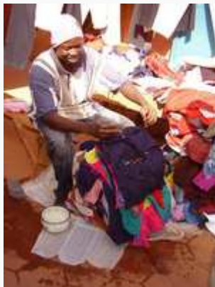
Vendeur de friperie