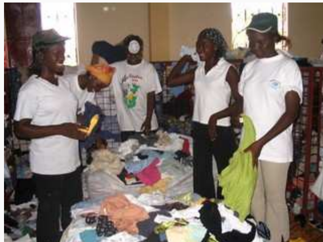
Les trieuses du Relais Burkina