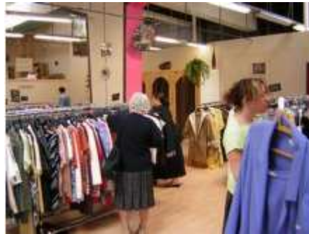
Une boutique Ding Fring

Il permet de revendre à petits prix les plus beaux vêtements que vous donnez au Relais. Ding Fring est le premier réseau français de friperies solidaires. Réparties autour des Relais, les cinquante quatre boutiques DING FRING vous proposent des vêtements (hommes, femmes, enfants), des chaussures, des sacs à main, du linge de maison, de bonne qualité, à petits prix, tout au long de l'année.